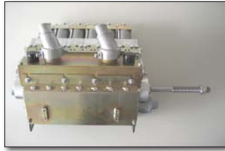
CONEX® Reflex-Klappenperlschleuder mit 6 Klappen à 5 cm

Für alle Maschinentypen, die für die Glasperlen-Nachstreuung vorgesehen sind